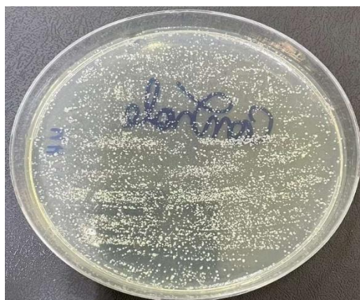
Figura 2. Teste de controle negativo.