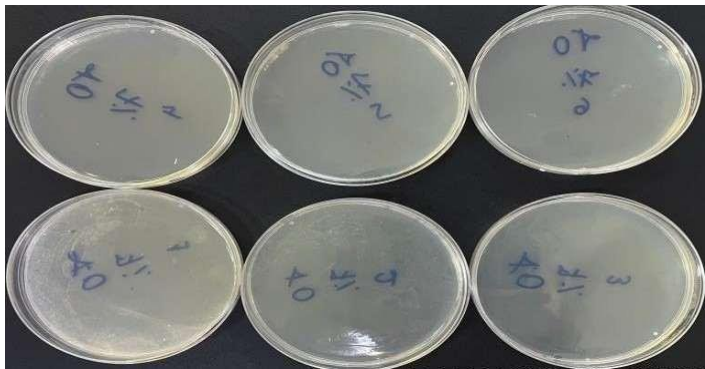
Figura 6. – Método pour plate contato imediato (concentração de 7% do extrato glicólico).