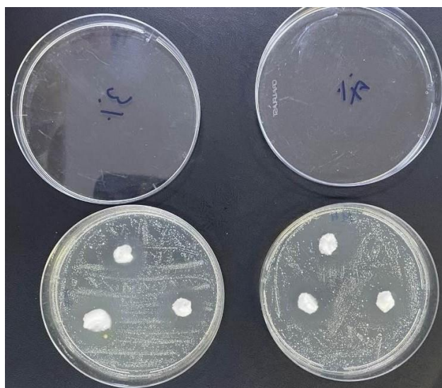
Figura 1. Teste de difusão em poço das concentrações de 3% e 7%.