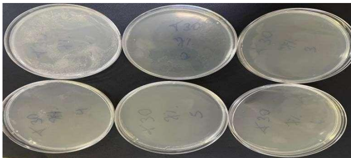
Figura 7. – Método pour plate contato de 30 minutos (concentração de 7% do extrato glicólico).