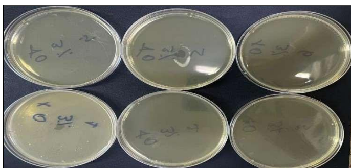
Figura 3. Método pour plate contato imediato (concentração de 3% do extrato glicólico).