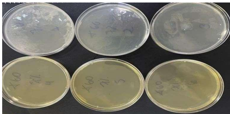
Figura 8. – Método pour plate contato de 60 minutos (concentração de 7% do extrato glicólico).